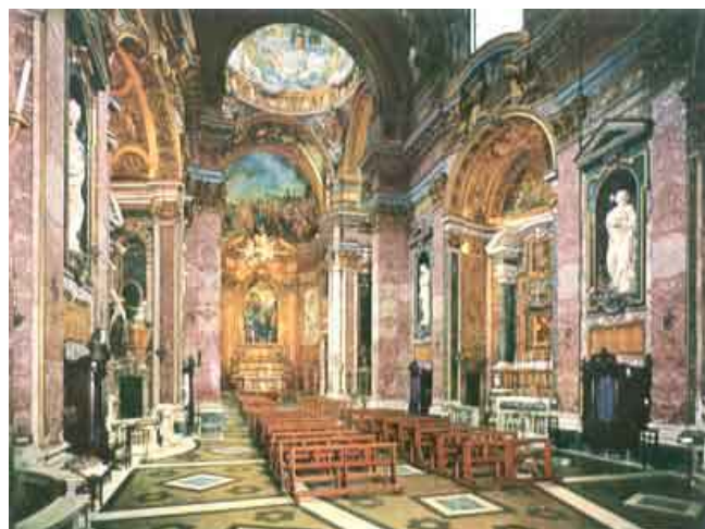
Abside su progetto di Carlo Fontana (1673). Nel catino "Predicazione di Cristo alle turbe" affresco di A. Milani (1732)