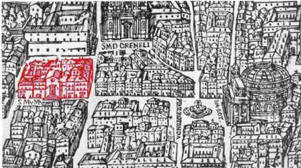
Chiesa e Casa di S. Maria Maddalena in una incisione di Lafrery per una sua carta topografica di Roma del 1577