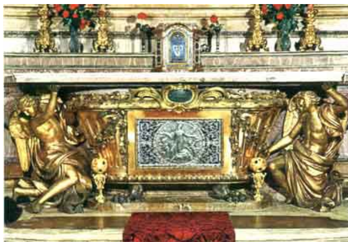
Cappella di S. Camillo preparata per la Beatificazione (8 aprile 1742). progettatori G. Francesco Rosa e F. Nicoletti. La tela centrale è di Placido Costanzi (1749); sotto la mensa dell'Altare, urna che racchiude il corpo del Santo. Opera di F. Giardoni e V. Consalvi