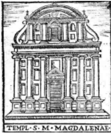
La facciata in una incisione del 1500, utilizzata per una Guida di Roma