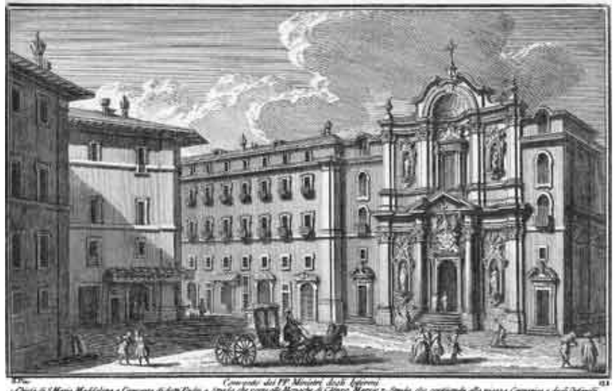
Incisione di Giuseppe Vasi del 1756