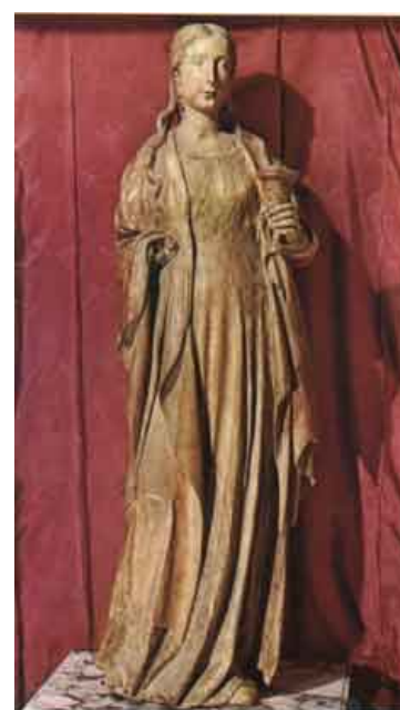
S. Maria Maddalena Statua lignea del XV sec.