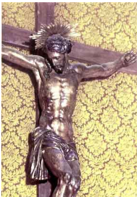
Il Crocifisso che confortò S. Camillo, opera lignea del sec. XVI, è conservato in una Cappella progettata dall'Arch. Francesco Nicoletti (dal 1762 al 1764)