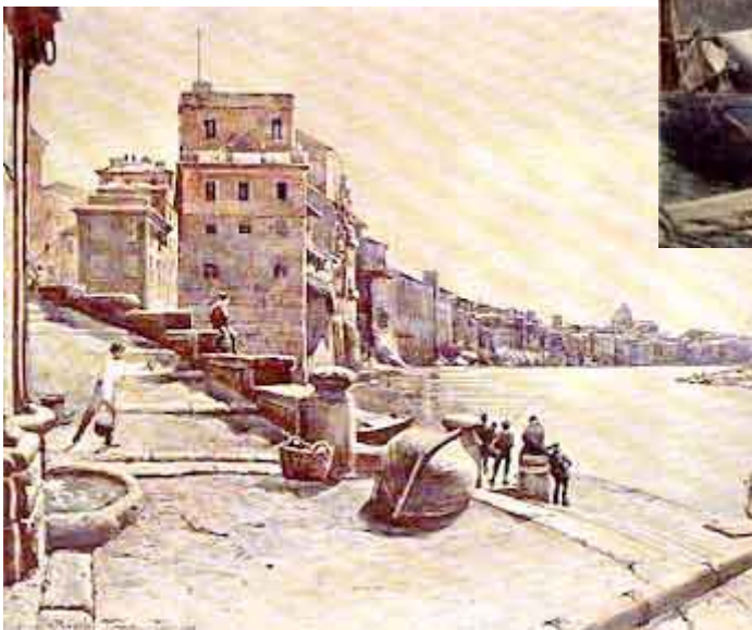
1880 - Acquerello di Ettore Roesler, Franz