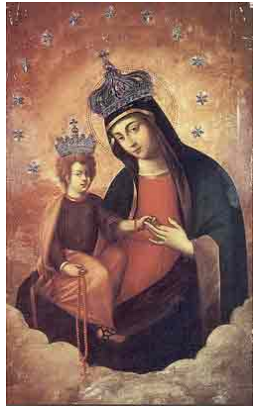
L'Armellini (1891) nella sua Guida scrive che “Ivi rimase la sacra immagine fino all’anno 1664 , allorché papa Clemente VIII ordinò a Carlo Rainaldi, buon architetto di quei tempi, di edificare una magnifica chiesa ove con maggior decoro si potesse collocare , approvando il disegno che aveva già presentato, tanto per questa quanto per l’altra simmetrica di s. Maria di Monte Santo, che e dall’altro lato della via del Corso.”