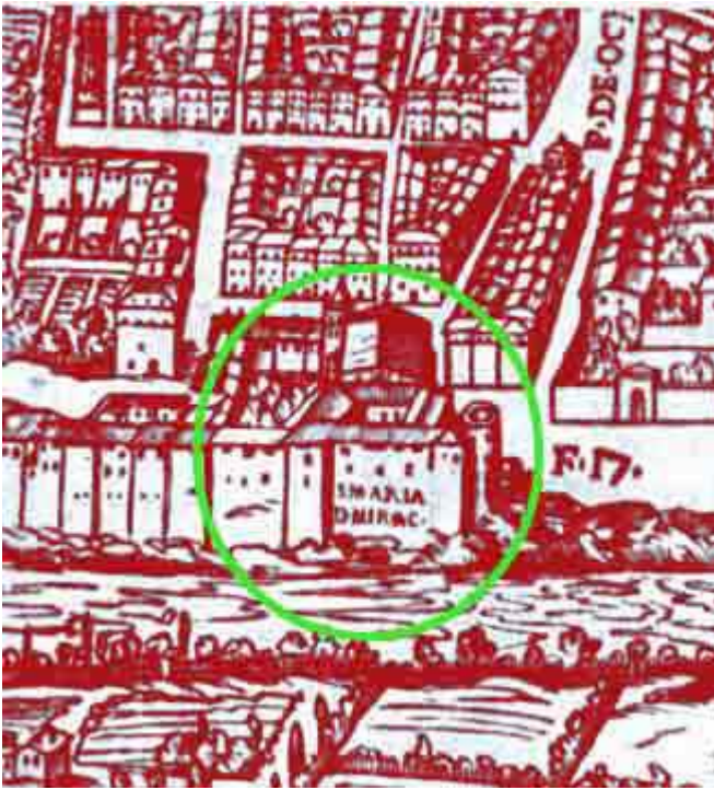
La Chiesina sorgeva in riva al Tevere. Il sito oggi è individuabile nei pressi di Ponte Regina Margherita , lato Piazza del Popolo . Se ne può vedere una prospettiva topografica in questa pianta di Carlo Losi che si rifà a precedenti incisioni del 1577.