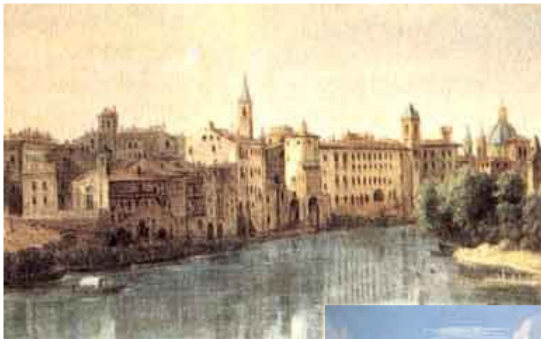
“Case sul Tevere” , acquarello di Hendrik F. van Lint

Non esiste più la Chiesina con alloggi adiacenti in riva al Tevere, ma l’Immagine della B.V. Maria è in questa nuova Chiesa in Piazza del Popolo, esposta alla venerazione dei fedeli. Acquarello di Anonino del ‘700, “Piazza del Popolo e le due Chiese”