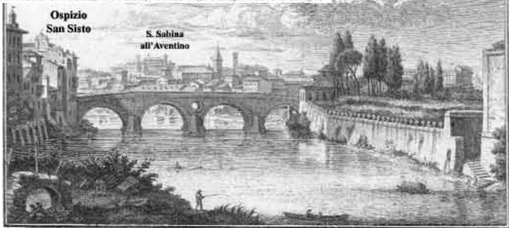
3. Ponte Sisto. 4. S. Sabina e Ponte Tevere, e Ospizio Ecclesiastico di Ponte Sisto. 5. S. Trinità sul Monte Aventino, e S. Sisto.