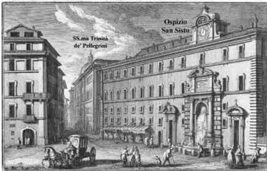
1. Piazza del Ponte Sisto, a. Chiesa e Caserella di S. Trinità, e Ospizio Ecclesiastico di Ponte Sisto. 2. S. Sabina, e Avvenna della di ponte Sisto, a. Collispii sulclivo, e Parte dell' Ospizio de' Pellegrini.